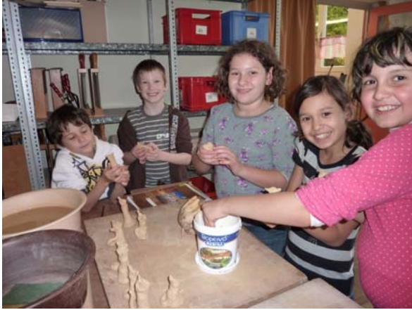
Keramik-Arbeiten für die Herbstfeier