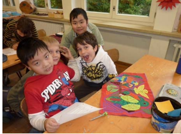
Vorbereitungen im Team