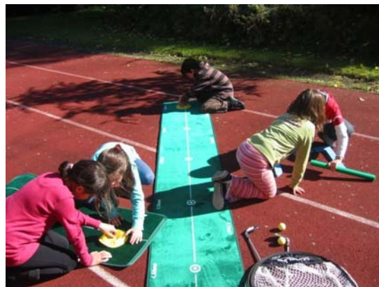
Kl. 3/4c-gt: Golftraining auf dem Schulgelände